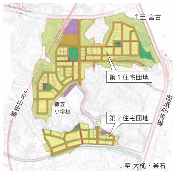
織笠地区復興整備事業の計画図

織笠地区では全家屋のほぼ5割に当たる約540戸が全壊や大規模半壊などの被害を受けました。今回の防集事業では織笠小学校北側一帯の山地を切り崩し、約13・1畧の宅地を第1住宅団地として造成。自力再建住宅や災害公営住宅が建てられるようにします。区画整理事業は第1団地の工事で発生した土を