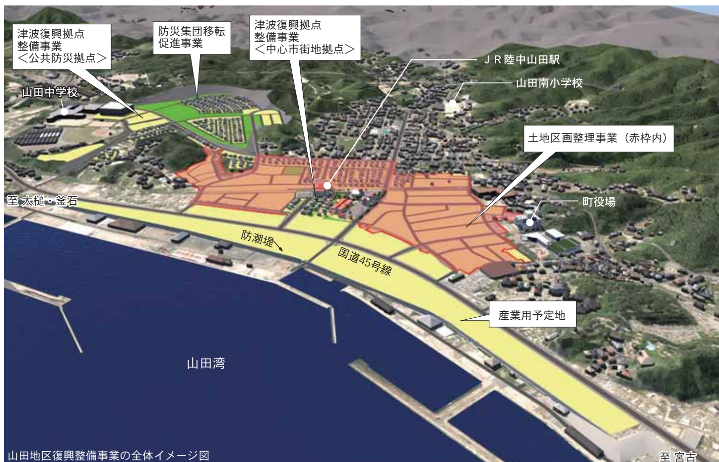
山田地区復興整備事業の全体イメージ図

安全祈願祭は工事関係者や町民ら約140人が出席。神事の中で佐藤町長が盛り土に植えた笹を鎌で刈って土地を整える「刈初め（かりぞめ）の儀」を行った後、町長や昆暉雄・町議会議長、達増拓也・岩手県知事（代理）、阿部幸栄・山田町商工会会長らが神前に玉串を供えて工事の安全を祈願しました。